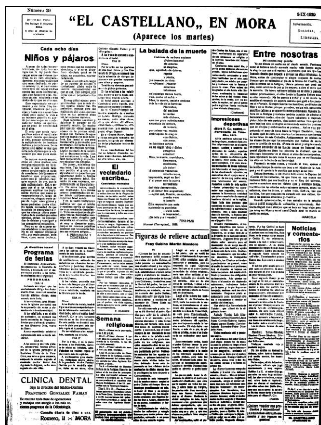
5. Primera crónica deportiva de Paco en El Castellano ( El Castellano , XXV, 6.383, 3-IX-1929, p. 2)