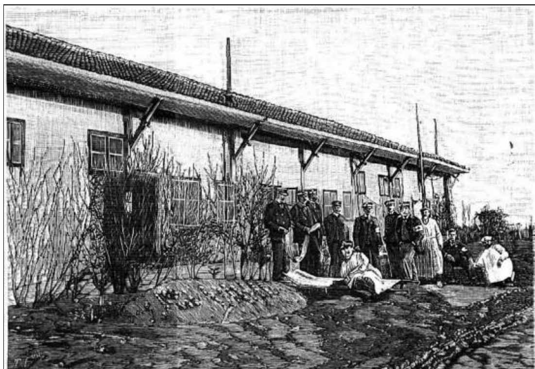
Santander.—Vista exterior del sanatorio instalado para atender a los heridos y enfermos procedentes del ejército de Cuba