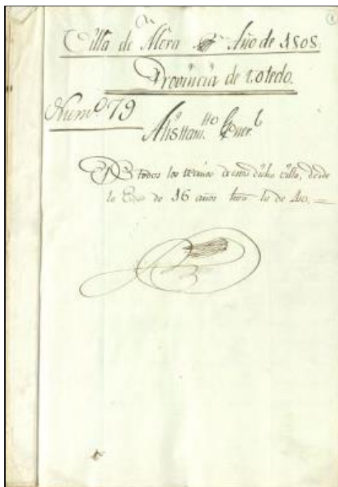
Folio inicial del Alistamiento general de 1808 (Archivo de Castilla-La Mancha)

julio de 1854 (con 281 nombres), 5 a la que cabe sumar, en este mismo año, otra «para los monumentos que se han de erigir a la memoria de los señores Argüelles, Calatrava y Mendizábal» (que añade 107 más), 6 y un inventario de expedientes de fallidos de 1858 (con 183 morachos y morachas), 7 así como un nuevo catálogo de electores de 1860 (con 94 vecinos varones). 8