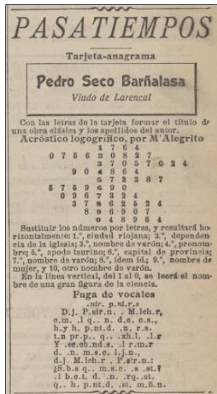
El Mundo , 21-X-1907

Desde su primer número, El Mundo inserta en la tercera de sus cuatro páginas una sección de pasatiempos, cosa que por entonces no dejaba de constituir una relativa rareza en la prensa diaria, pues si es verdad que hallamos tal sección en casos como los del Heraldo de Madrid o El Correo Español , no ocurre lo mismo en la mayor parte de los grandes periódicos de la capital, sean El Imparcial , El Liberal , La Correspondencia de España , La Época o El Globo .