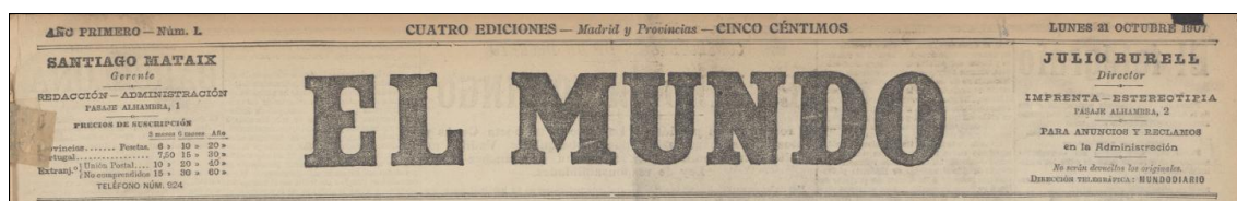
Cabecera del número inicial del periódico

El Mundo que nos ocupa aparece en Madrid el 21 de octubre de 1907. Fundado por el abogado, periodista y político liberal Santiago Mataix (1871-1918), diputado y senador en varias legislaturas, se publicará a lo largo de un cuarto de siglo, hasta el 29 de julio de 1933. 1